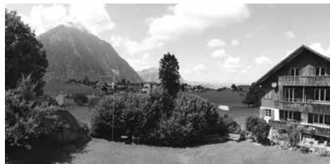
Grandiose Lage zwischen Bergen und See.

In den «gästefreien Zeiten» wurde der Boden im Speisesaal des Chalets erneuert und die Geschirrtkehe im grossen Aufenthaltsraum des Jugendhauses ersetzt. Die jährlichen Veränderungen und Erneuerungen wurden positiv gewertet.