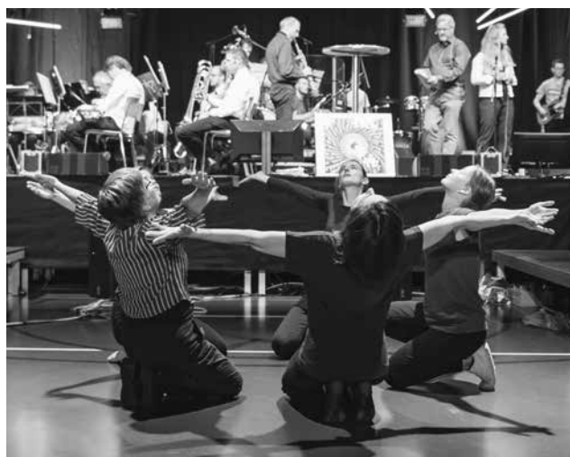
Mit Leib und Seele: Anbetung am Jahresfest.