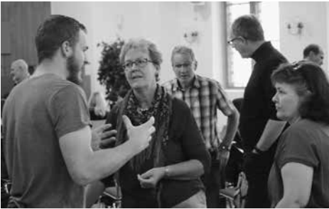
In der Pause der Herbst-DV.