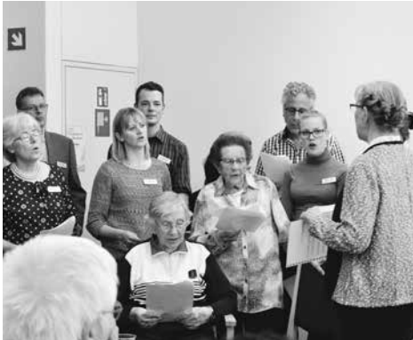
Singen verbindet und erfreut: Das Altersheimchörli.

Im vergangenen Jahr feierte das APH Brienz EGW sein zehnjähriges Jubiläum. Gestartet wurde mit einem Dankgottesdienst im Februar mit einer Predigt über Psalm 40,12: «Du aber, Herr, wollest deine Barmherzigkeit nicht von uns nehmen; lass deine Güte und Treu uns überall behüten.» Es gab viel Grund zum Danken: Das Heim wurde im ersten Jahrzehnt vor ansteckenden Infektionskrankheiten, grösseren Schäden und Unfällen bewahrt. Und es fanden sich immer die nötigen Mitarbeitenden – zwölf sind seit 2009 dabei! Daneben konnten alle finanziellen Verpflichtungen erfüllt werden.