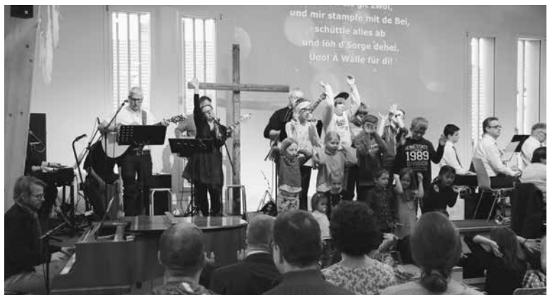
Festliche Einweihung des Zentrums des EGW Kerzers, 7. April 2019.