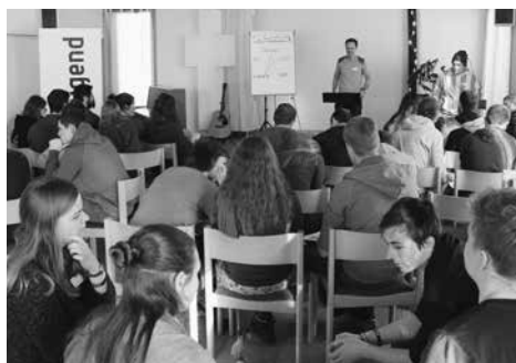
Interaktion am Jugendleitertag+.

Das Kernteam Jugend musste das Jugend-Pfingsttreffen mangels Anmeldungen absagen – wohl der traurigste Moment des Jahres. Das Fehlen einer Unterkunft 2018 könnte dazu beigetragen haben – obwohl mit dem Campus Perspektiven in Huttwil diesmal wieder eine super Unterkunft zur Verfügung stand. Statt Trübsal zu blasen, sah das Kernteam eine Chance zur Neuorientierung. In der erwähnten Umfrage gaben 34 Ressortleiter/Jugendarbeiter und 195 Jugendliche