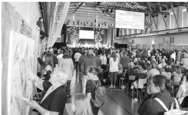
Kreativ-Wand in der Mehrzweckhalle.