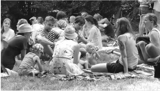
Sommerfest in der Brunnmatt.

Ein Ehepaar, das im September in eine Wohnung an der Bottigenstrasse in Bümpliz zog, schätzt die Offenheit und Freude im Block (eine Männer- und vier Frauen-WGs, drei Ehepaare und vier Familien). Die Gemeinschaft lebt davon, dass jeder Einzelne im Alltag auf andere zugeht und den Kontakt sucht. Die Einzelnen sollen im Glauben an Christus gestärkt werden.