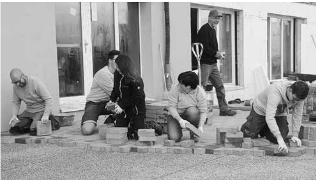
Viele Hände packen an fürs neue Zentrum des EGW Waltrigen.

Der Ressortleiter Liegenschaften nahm erfreut zur Kenntnis, mit welchem Engagement die Bezirke die Vereinshäuser unterhalten und neuen Bedürfnissen anpassen.