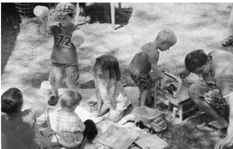
Im Spiel erwacht Kreativität.

Aber es sind nicht in erster Linie die äusseren Formen von Gottesdienstgestaltung, Liederwahl und Glaubensbekenntnis, welche dem Christsein Wurzeln und Flügel verleihen, sondern die lebendige, kraftvolle und abhängige Herzensbeziehung. Die Angst, etwas Vertrautes zu verlieren, verbaut die Chance, von Gottes Geist geleitet etwas Besseres zu gewinnen.