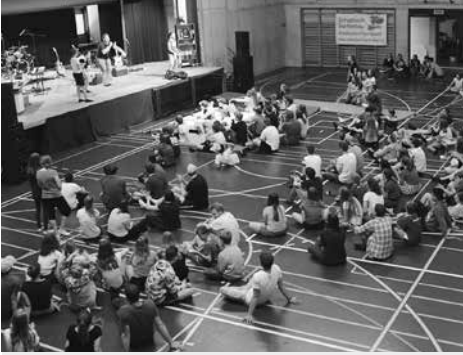
Geistliche Impulse für den Alltag am Teenie-Pfingsttreffen.

Auskunft über ihre Bedürfnisse. Die meisten Jugendlichen wünschen einen Jugend-Event oder einen grossen Jugendgottesdienst. Dies führte zur Entscheidung, das Jugend-Pfingsttreffen in der bisherigen Form nicht mehr anzubieten und die bestehenden Jugendabende weiter zu stärken.