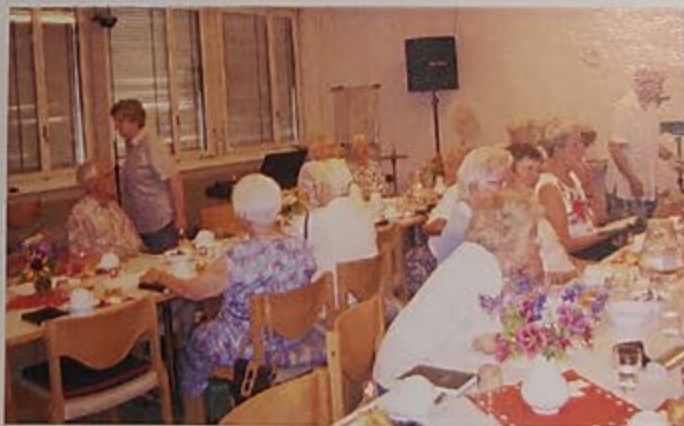
EGW-Raum bei der Swisscom

Im Gebäude, wo die Swisscom untergebracht war, wurde ein Raum frei, der gemietet werden konnte und vorerst für die Jugendarbeit bereitstand. Die ganze Gemeinde kehrte im Jahr 2000 dort ein. Somit ging der Wunsch für Morgengottesdienste in Erfüllung. Vorgängig dieser Aktionen erlebten wir die Zeit, wo die Zweispurigkeit ein Ende nahm und an Stelle der Brüdergemeinschaft ein Ortsvorstand gebildet und wir dem Bezirk Schönebühl zugeordnet wurden. 1996 erfolgte der Zusammenschluss von der EG und der LKG zum Evangelischen Gemeinschaftswerk. Der Akt des Zusammenschlusses wurde im Münster in Bern gefeiert. Der