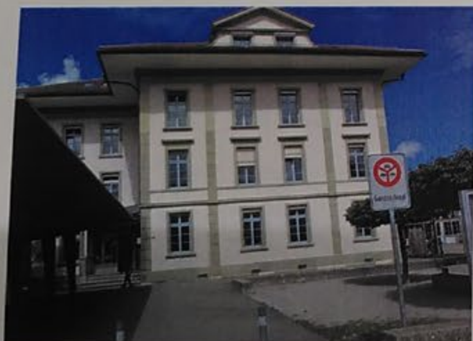
Oberes Schulhaus als Ort der Begegnung

Diejenigen, die ihre Wurzeln in der EG hatten, versammelten sich in diesem Haus (Bild) zur Bibelstunde, und die LKGLer trafen sich in der Wohnung von E.+ L. Geissbühler zur Durchführung von Bibel- und Singstunden