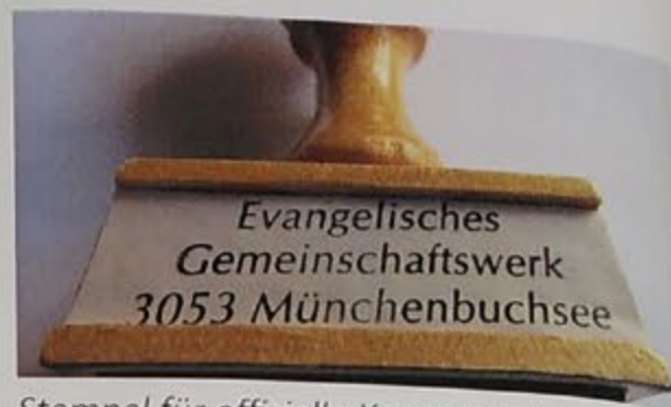
Stempel für offizielle Korrespondenz

Titel «Evangelisches Gemeinschaftswerk» war uns schon ein Begriff, bevor die intensive Suche nach einem Namen für das vereinigte Werk im Gang war. Der Stempel mit dem Ortsnamen zeigt dies deutlich.