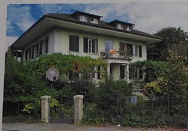
Hier fanden Bibelstunden der EG statt

Die Geschichte beginnt mit einer lockeren Verbindung von zwei Organisationen. Für die Geschichtsschreiber sind nur Angaben bis ins Jahr 1949 möglich. Frühere sind nicht mehr auffindbar. Es handelt sich hier um Leute, die einerseits zur Evangelischen Gesellschaft und andererseits zum Verband Landeskirchlicher Gemeinschaften gehörten. Dieses Gebilde wurde durch eine Brüdergemeinschaft, die zu gleichen Teilen bestückt