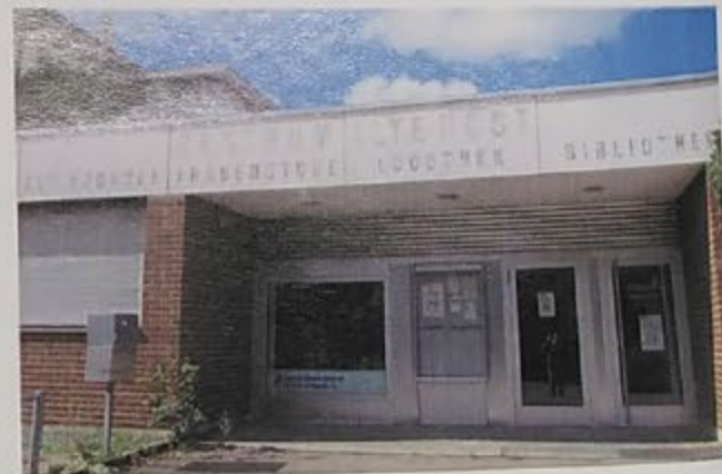
Gottesdienste feiern in der Alten Post

wuchs, und mit der Zeit wurde auch der Platz im EGW-Raum eng und genügte den feuerpolizeilichen Vorschriften nicht mehr. Ein neuer Umfang wurde nötig. In der Alten Post, wo auch die Gemeindebibliothek beheimatet war, konnten wir einziehen.