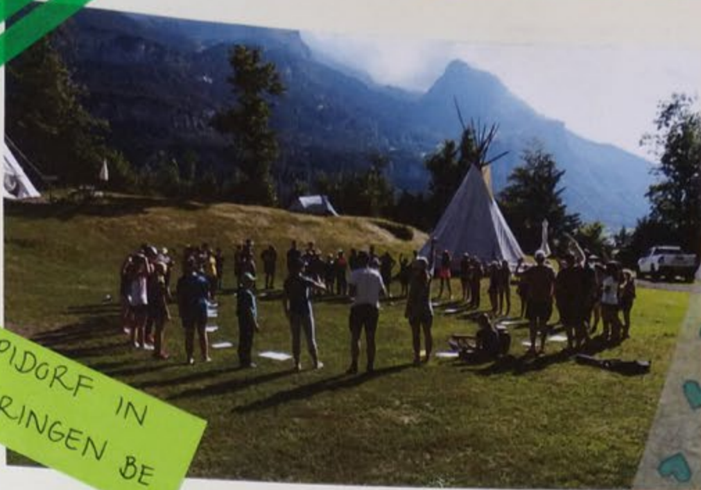
TIPIDORF IN MEIRINGEN BE